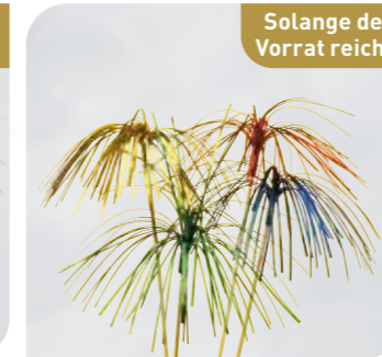
Glanzpalme Vulkan Art.-Nr. 36 269 VE: 500 Stück Preis: € 16,00