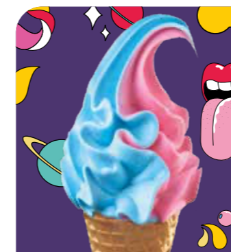
Galaxy Eis mit Kaugummigeschmack und Eis mit Himbeere