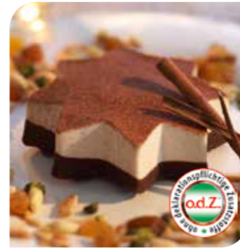
Zimteis-Stern Eine Komposition aus Zimt-Eiscreme mit einem Kern aus Bratapfeis, auf kakaohaltiger Fettglasur