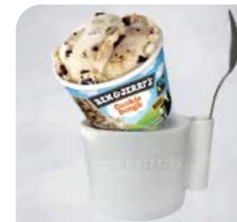
Ben & Jerry's Shortybecher (ohne Dekoartikel) Art.-Nr. 36 010 VE: 6 Stück Preis: € 28,00