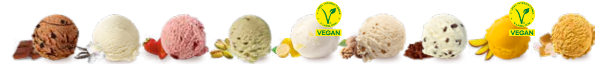
1. Schokolade · 2. Bourbon-Vanille/Bourbon-Vanille vegan · 3. Erdbeere/Sorbet Erdbeere · 4. Pistazie · 5. Sorbet Zitrone · 6. Walnuss · 7. Stracciatella · 8. Sorbet Mango · 9. Salted Caramel / Saisonvariante Herbst/Winter: Zimt