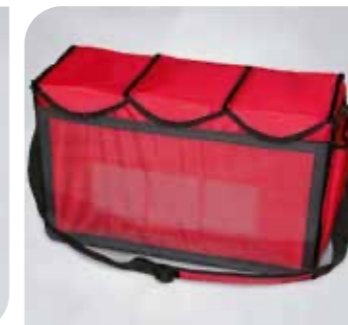
Hawking Bag Eisverkaufstasche Art.-Nr. 50 001 Größe: H 32 cm, B 53 cm, T 22 cm VE: 1 Stück Preis: € 41,00