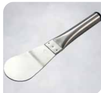
Eisspatel Art.-Nr. 36 552 VE: 1 Stück Preis: € 21,00