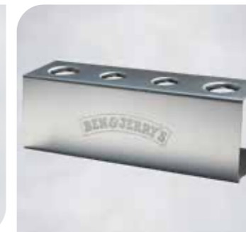
Ben & Jerry's Waffeltütenhalter aus Edelstahl Art.-Nr. 38 633 VE: 1 Stück Preis: € 28,00