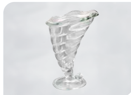
Fortuna Art.-Nr. 37 130 Größe: H 18 cm, Ø 12,5 cm VE: 12 Stück à 320 ml Preis: € 32,00