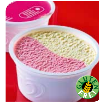
Eisbecher Erdbeer Vanille Eis mit Vanille- und Erdbeergeschmack