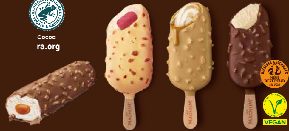
CARAMEL & NUTS RIEGEL PINK LEMONADE DOUBLE GOLD CARAMEL BILLIONAIRE VEGAN MANDEL