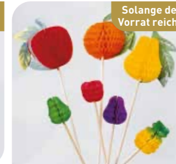
Eisdeko Früchtesticker Art.-Nr. 36 294 VE: 344 Stück Preis: € 12,00