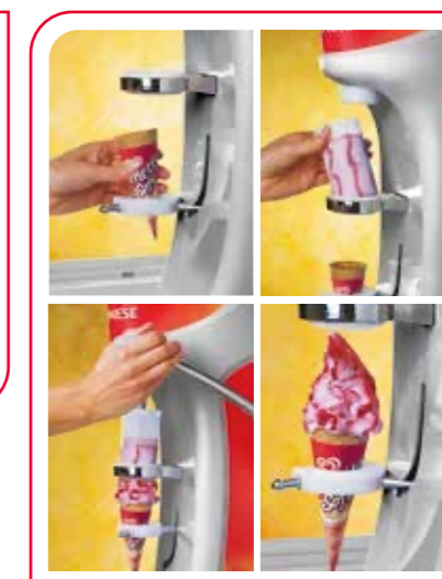
Langnese Soft Dispenser** Für Kombiverkauf aus der Impulstreue