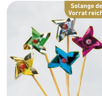
Windrad Art.-Nr. 36 220 VE: 500 Stück Preis: € 25,00