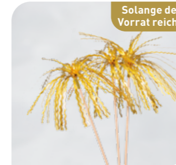
Glanzpalme Gold Art.-Nr. 36 265 VE: 576 Stück Preis: € 12,00