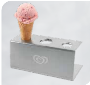
Waffeltütenhalter aus Edelstahl Art.-Nr. 38 630 VE: 1 Stück Preis: € 28,00