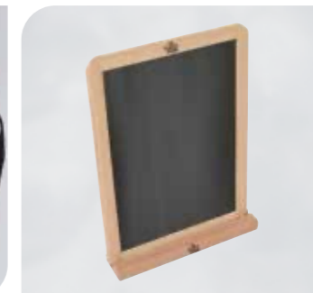
Carte D'Or Schiefertafel Art.-Nr. 36 105 Größe: DIN A4 VE: 1 Stück Preis: € 2,99