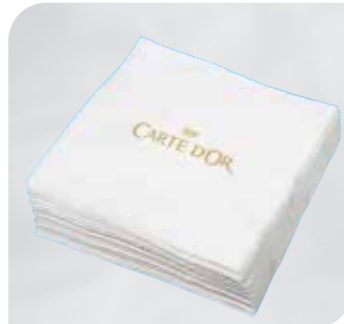
Carte D'Or Servietten, zweilagig Art.-Nr. 36 590 Größe: 1/4 Falz, L 40 cm, B 40 cm VE: 1.200 Stück Preis: € 44,00