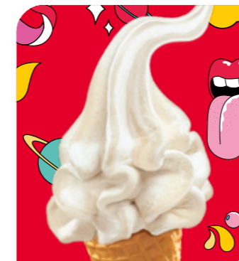
Vanilla Eis mit Vanillegeschmack

Biete Deinen Gästen ein ganz besonderes Eis-Erlebnis: Einzeln portioniert und mit Toppings individualisierbar.