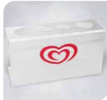
Waffeltütenhalter aus Plexiglas Art.-Nr. 38 628 VE: 1 Stück Preis: € 12,00