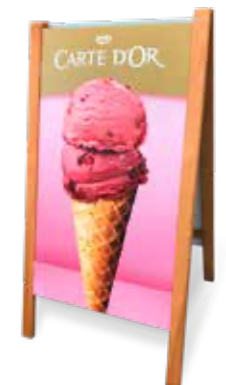
Carte D'Or Doppelstandschild mit Schreibtafel

Weitere Informationen zu den Carte D'Or Werbemitteln erhältst Du über Deinen Verkaufsberater.