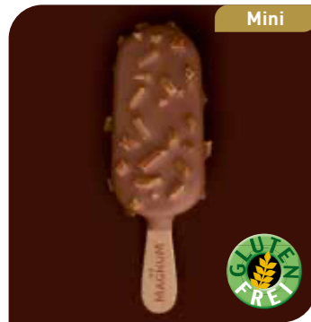
Magnum Mini Mandel Leckeres Vanilleeis umhüllt von knackiger Milkschokolade mit Mandelstückchen

Sofort einsetzbar und individualisierbar mit Früchten, Saucen und Toppings