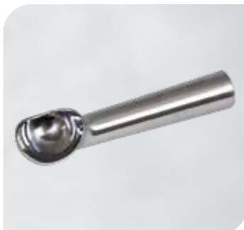
Dipper 20stel: 38 202 24stel: 38 210 30stel: 38 750 VE: 1 Stück Preis: € 18,00