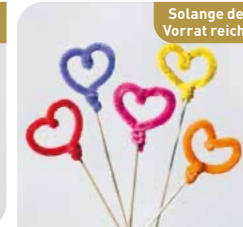
Langnese Herzen-Deko Art.-Nr. 36 301 VE: 576 Stück Preis: € 12,00