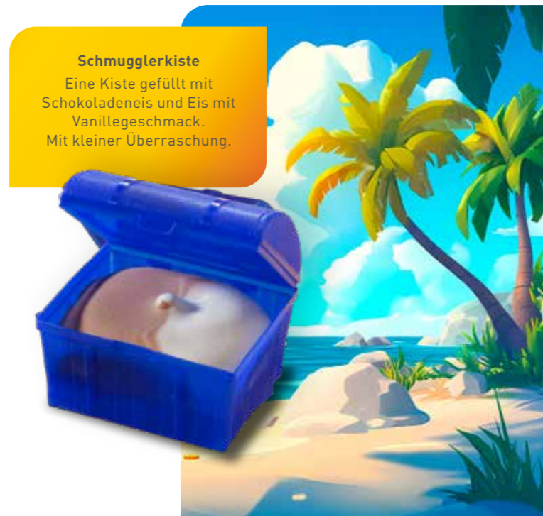
Schmugglerkiste Eine Kiste gefüllt mit Schokoladeneis und Eis mit Vanillegeschmack. Mit kleiner Überraschung.