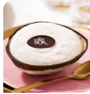
Kokosnuss Exotisches Kokosnusseis, servierfertig angerichtet in einer halben Kokosnussschale