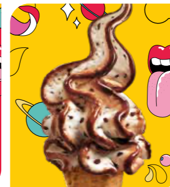
Stracciatella Eis mit Vanillegeschmack, Schokoladensauce (19%) und Schokoladenstückchen (4%)