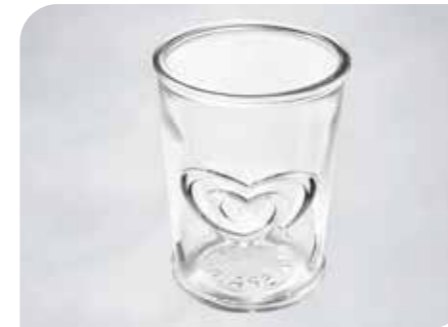
Langnese Schlemmerbecher Art.-Nr. 37 010 Größe: H 10 cm, Ø 7,7 cm VE: 12 Stück à 200 ml Preis: € 16,50