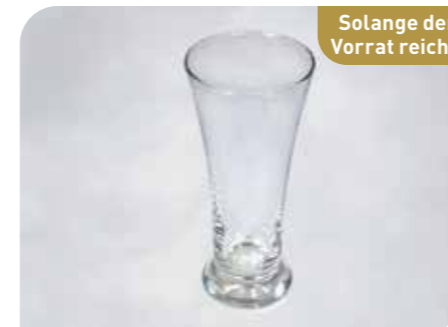
Eisshake Art.-Nr. 36 071 Größe: H 18 cm, Ø 8 cm VE: 12 Stück à 330 ml Preis: € 23,00