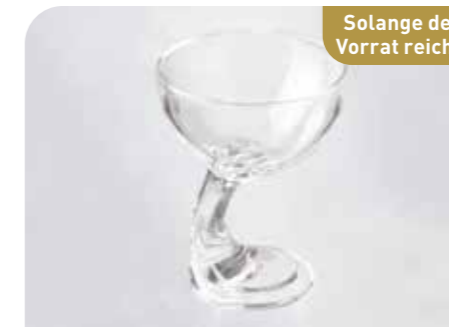
Djerba Art.-Nr. 36 750 Größe: H 14 cm, Ø 11 cm VE: 12 Stück à 350 ml Preis: € 28,00