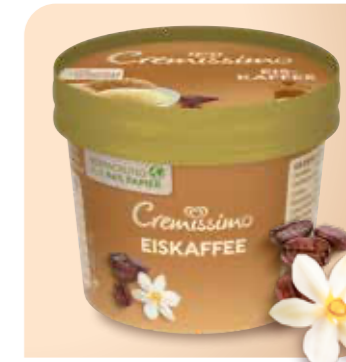
Cremissimo Becher Eiskaffee Cremiges Kaffee- und Vanilleeis in der perfekten Snackgröße