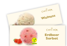
Carte D'Or Einsteckkärtchen