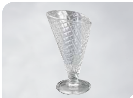
Gelato Art.-Nr. 37 100 Größe: H 17 cm, Ø 9,5 cm VE: 12 Stück à 210 ml Preis: € 29,00