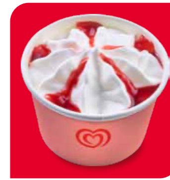
Langnese Becher Vanilla-Himbeer Eis mit Vanillegeschmack und Himbeersauce