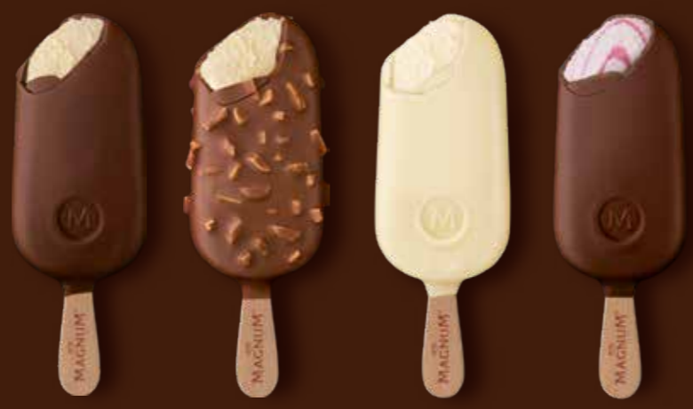
CLASSIC MANDEL WHITE CHOCOLATE YOGHURT & RASPBERRY

DOUBLE CHERRY KIRSCH, SCHWARZE JOHANNISBEERE-HIMBEERE DOUBLE HAZELNUT HASELNUSS, MANDEL, PISTAZIE