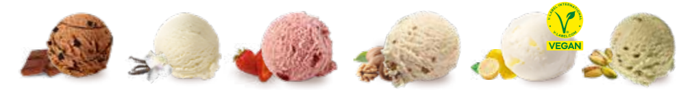
1. Schokolade · 2. Bourbon-Vanille/Bourbon-Vanille vegan · 3. Erdbeere · 4. Walnuss · 5. Sorbet Zitrone · 6. Pistazie