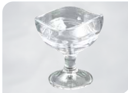
Acapulco Art.-Nr. 37 020 Größe: H 13 cm, Ø 12 cm VE: 12 Stück à 330 ml Preis: € 26,00