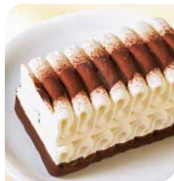
Mini Viennetta Vanilla Eis mit Vanillegeschmack, von feinen schoko-braunen Knisperschichten durchzogen