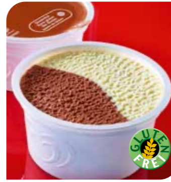
Eisbecher Schoko Vanille Eis mit Vanillegeschmack und Schokoladeneis