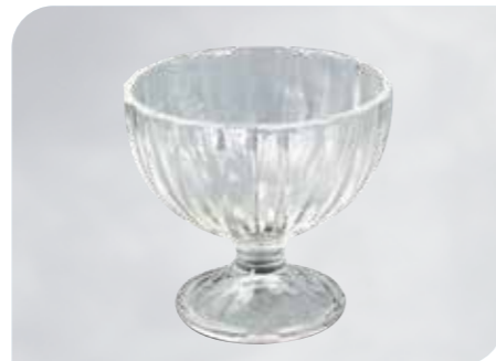
Alaska Art.-Nr. 37 025 Größe: H 9,5 cm, Ø 10 cm VE: 12 Stück à 265 ml Preis: € 13,00