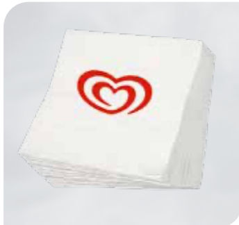
Langnese Servietten, zweilagig Art.-Nr. 36 102 Größe: 1/4 Falz, L 24 cm, B 24 cm VE: 1.200 Stück Preis: € 23,00