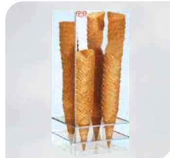
Waffeltütenspender aus Acrylglas Art.-Nr. 38 050 Größe: H 55 cm, B 23,6 cm, T 23,3 cm VE: 1 Stück Preis: € 52,00