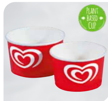
Langnese Portionsbecher Art.-Nr. 39 806 VE: 600 St. à 300 ml Preis: € 68,00