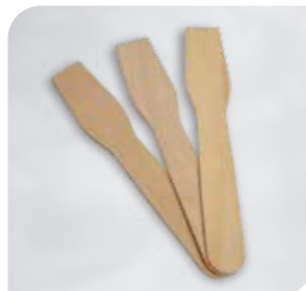
Holzspateneislöffel Art.-Nr. 37 451 VE: 1.000 Stück Preis: € 11,00