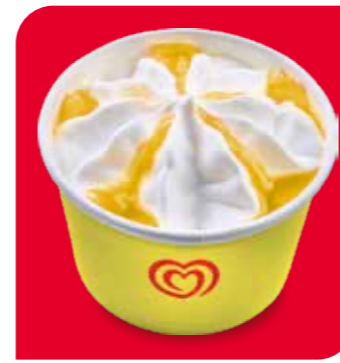
Langnese Becher Zitrone Eis mit Zitronengeschmack