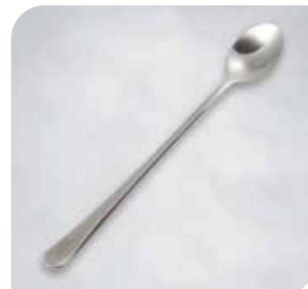
Eislöffel Schneller Schlemmer Art.-Nr. 36 017 Größe: L 19,5 cm VE: 12 Stück Preis: € 24,00