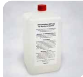
Zitronensäure Art.-Nr. 38 199 VE: 1 Stück à 2 Liter Preis: € 14,00