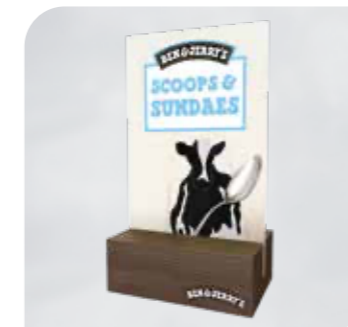
Ben & Jerry's Menüstand für Eiskarten Art.-Nr. BJ 20 00 20 VE: 5 Stück Preis: € 20,00