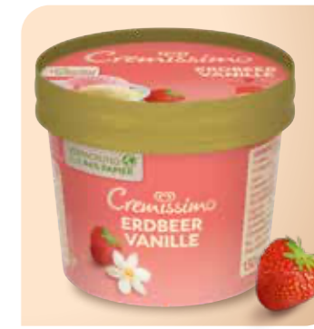
Cremissimo Becher Erdbeer Vanille Cremiges Vanille- und Erdbeereis in der perfekten Snackgröße