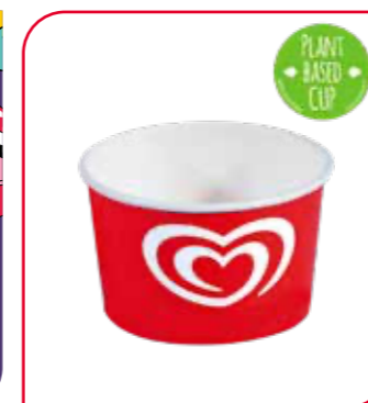
Langnese Portionsbecher* Art.-Nr. 39 500 VE: 100 St. à 175 ml Preis: € 8,00