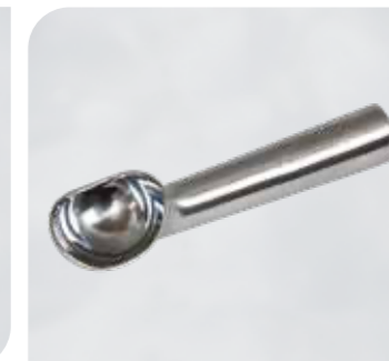
Ben & Jerry's Dipper 20stel Art.-Nr. 10 030 VE: 1 Stück Preis: € 18,00