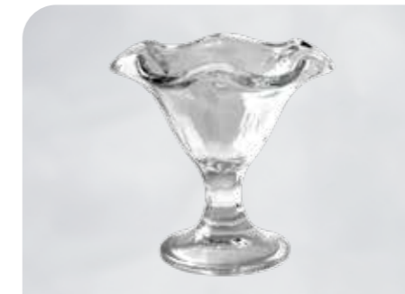
Flora Art.-Nr. 38 717 Größe: H 14 cm, Ø 13 cm VE: 12 Stück à 240 ml Preis: € 27,00