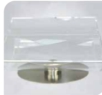
Eislöffelbox Art.-Nr. 38 091 VE: 1 Stück Preis: € 96,00