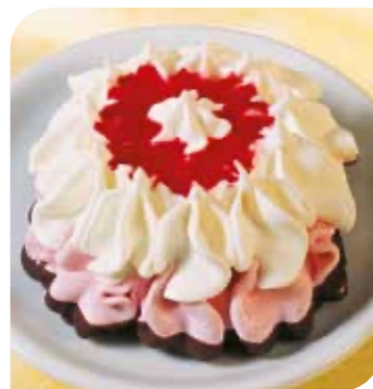
Royal Eistörtchen Erdbeer Kleines Törtchen aus Eis mit Vanillegeschmack, Eis Erdbeer und feiner Erdbeersauce