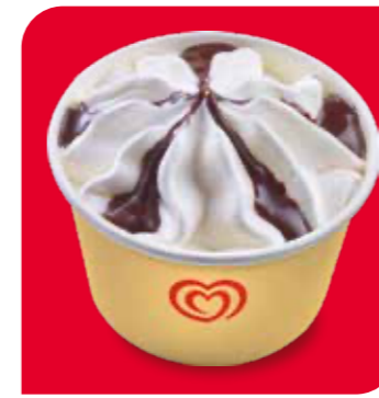
Langnese Becher Vanilla-Schoko Eis mit Vanillegeschmack und Schokoladensauce