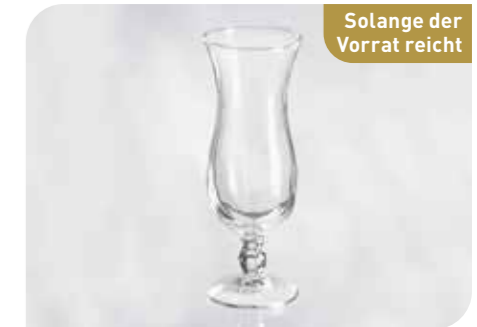
Lilie Art.-Nr. 36 480 Größe: H 20 cm, Ø 7 cm VE: 12 Stück à 440 ml Preis: € 35,00