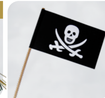
Piratenflagge Art.-Nr. 36 180 VE: 50 Stück Preis: € 3,50