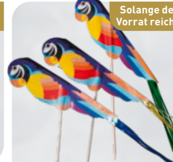
Eisdeko Papageien Art.-Nr. 36 330 VE: 100 Stück Preis: € 6,00