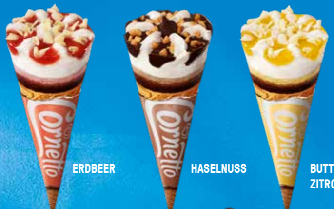
ERDBEER HASELNUSS BUTTERMILCH ZITRONE