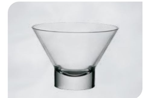
Ypsilon klar Art.-Nr. 36 019 Größe: H 9 cm, Ø 13 cm VE: 12 Stück à 375 ml Preis: € 21,00