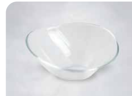
Vario Art.-Nr. 36 915 Größe: H 7 cm, Ø 15 cm VE: 12 Stück à 180 ml Preis: € 14,00