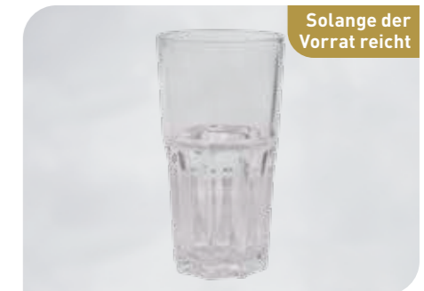
Smoothie Art.-Nr. 36 574 Größe: H 14 cm, Ø 7,5 cm VE: 12 Stück à 310 ml Preis: € 16,00