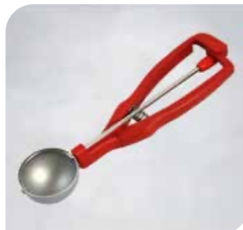
Outdoor-Portionierer 16stel: 37 079 20stel: 38 571 30stel: 38 318 40stel: 38 580 VE: 1 Stück Preis: € 24,00