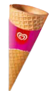
Waffeltüte für Soft- und Portionierreis**