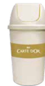
Carte D'Or Swing Lady