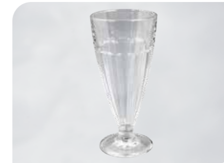
Eiskaffee Art.-Nr. 37 104 Größe: H 18 cm, Ø 8,5 cm VE: 12 Stück à 370 ml Preis: € 25,00