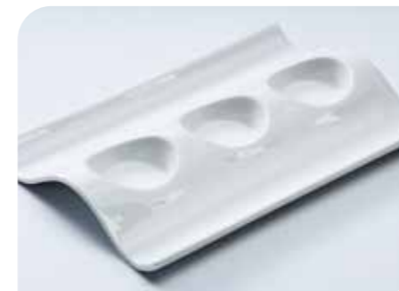
Random Art.-Nr. 36 025 Größe: L 32 cm, B 21 cm, H 3,5 cm VE: 6 Stück Preis: € 15,00