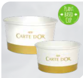
Carte D'Or Portionsbecher Art.-Nr. 50 000 VE: 630 St. à 195 ml Preis: € 55,00