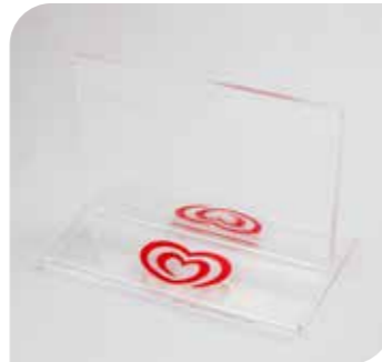
Tischaufsteller und Eiskartenhalter aus Plexiglas Art.-Nr. 36 125 VE: 10 Stück Preis: € 30,00