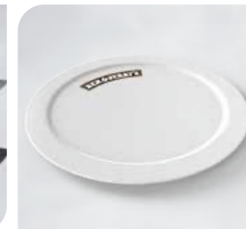
Ben & Jerry's Teller Art.-Nr. BJ 20 00 22 Größe: Ø 21 cm VE: 5 Stück Preis: € 20,00