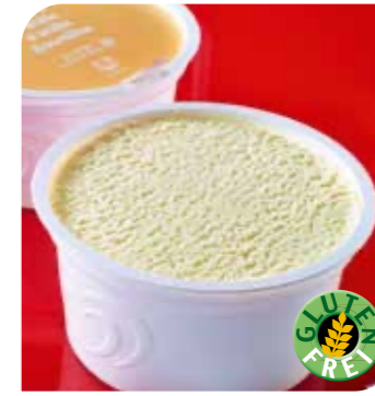
Eisbecher Vanille Eis mit Vanillegeschmack