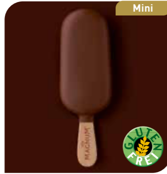
Magnum Mini Leckeres Vanilleeis mit einem knackigen Milkschokoladenüberzug