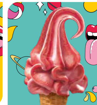
Erdbeer Eis mit Erdbeergeschmack und Erdbeersauce (15%)