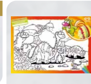
Malset Schmeckerfatz Art.-Nr. 36 251 Größe: B 42 cm, H 30 cm VE: 100 Stück Preis: € 16,00