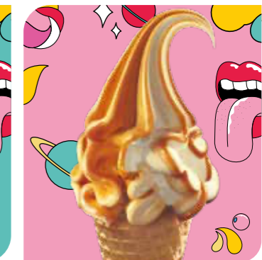
Vanilla & Caramel Eis mit Vanillegeschmack, Eis mit Karamellgeschmack und Karamellsauce (12%)