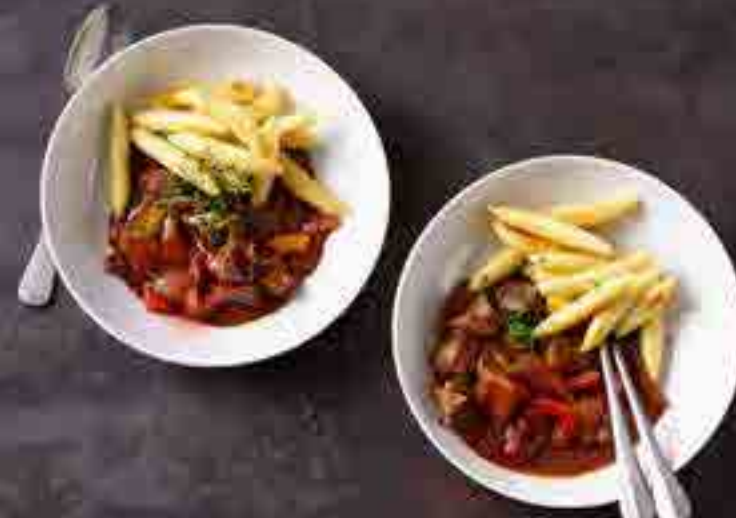
Gulasch mit Schupfnudeln