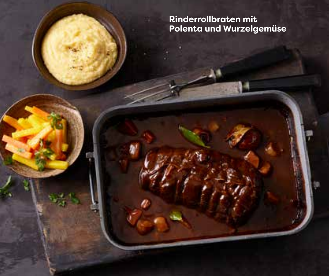
Rinderrollbraten mit Polenta und Wurzelgemüse