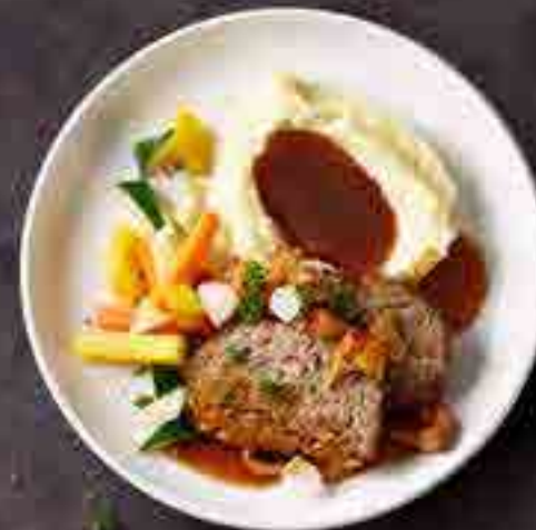
Hackbraten mit Kartoffelpüree und glasiertem Gemüse